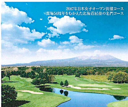
2007年日本女子オープン開催コース 開場54周年をむかえた北海道屈指の名門コース

札幌市中心部から車で道央自動車道を経て約70分 苫小牧西ICより約3分 千歳空港から車で約20分